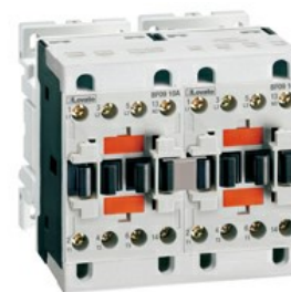
Styczniki w układzie nawrotnym BFA012