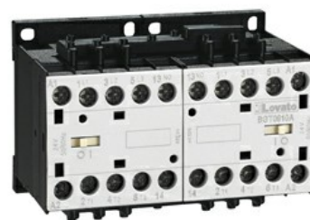
Styczniki w układzie nawrotnym BGT12