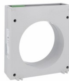
Toroidalne przekładniki prądowe