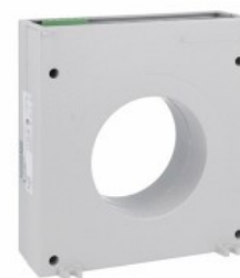
Toroidalne przekładniki prądowe