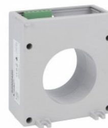
Toroidalne przekładniki prądowe