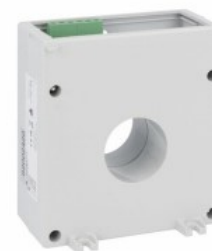
Toroidalne przekładniki prądowe