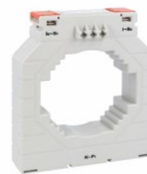
Transformatoare de curent DM4T4000 Solid-core