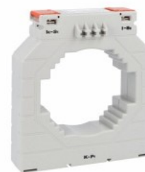
Transformatoare de curent DM4T3000 Solid-core