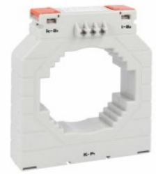
Transformatoare de curent DM4T1500 Solid-core