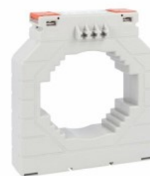
Transformatoare de curent DM4T1250 Solid-core