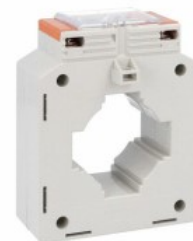
Transformatoare de curent DM3TP0800 Solid-core