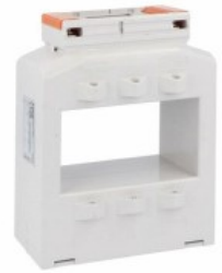
Transformatoare de curent DM37T2250 Solid-core