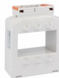
Transformatoare de curent DM37T2000 Solid-core