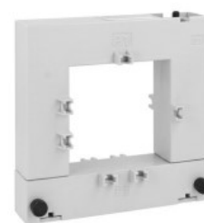
Transformatoare de curent DM2TA0800 Split-core