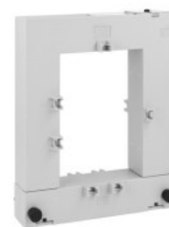
Przekładniki prądowe DM3TA1500 Rdzeń otwierany