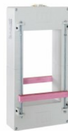
Trasformatori di corrente Current transformers Passante per barre