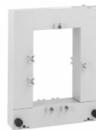
Trasformatori di corrente DM3TA2000 Apribile