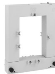
Trasformatori di corrente DM3TA1500 Apribile