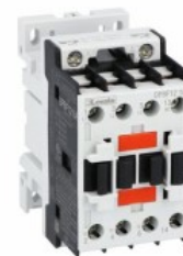
Contactor de putere DPBF12