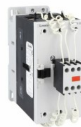
Contactor de putere BFK95