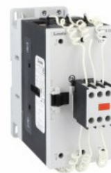
Contactor de putere BFK95