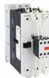
Contacteur de putere BFK95