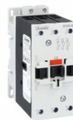
Contactor de putere BFD80