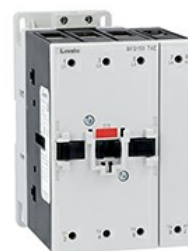
Contactor de putere BFD150