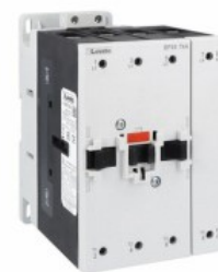
Contactor de putere BF95