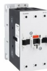
Contactor de putere BF95