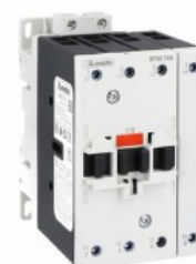
Contactor de putere BF80