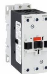
Contactor de putere BF80