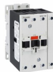
Contactor de putere BF65