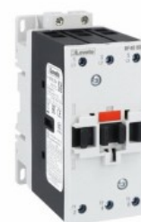
Contactor de putere BF40