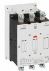
Contactor de putere BF330