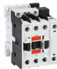
Contactor de putere BF26