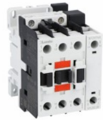
Contactor de putere BF26