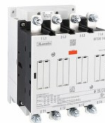
Contactor de putere BF230