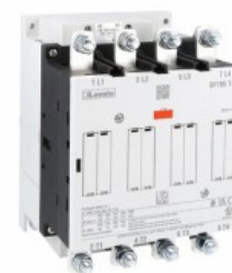
Contactor de putere BF195