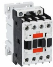
Contactor de putere BF18