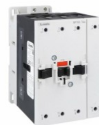
Contactor de putere BF150