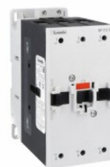
Contactor de putere BF115