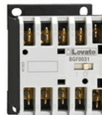
Contactor de putere BGF09