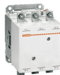
Contactor de putere B115