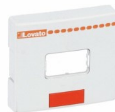
Osłona do BF00 oraz BF09... BF38 BFX80