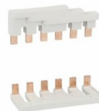
Stałe zestawy przyłączeniowe, 3 polowe, do BF95...BF150 BFX3401