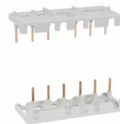
Stałe zestawy przyłączeniowe, 3 polowe, do BF26...BF38 BFX3201