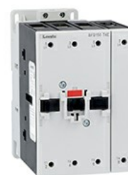
Stycznik mocy BFD150