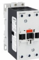
Stycznik mocy BF80