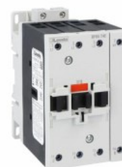
Stycznik mocy BF65