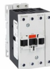
Stycznik mocy BF50