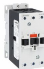
Stycznik mocy BF40