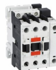
Stycznik mocy BF26