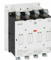
Stycznik mocy BF265